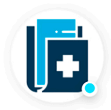
Estudios Médicos Imágenes

Te enumeramos algunas de las funcionalidades que podrás utilizar